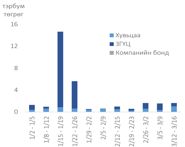
Арилжааны үнийн дүн /7 хоногоор/