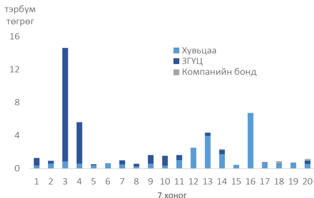
Арилжааны үнийн дүн /7 хоногоор/